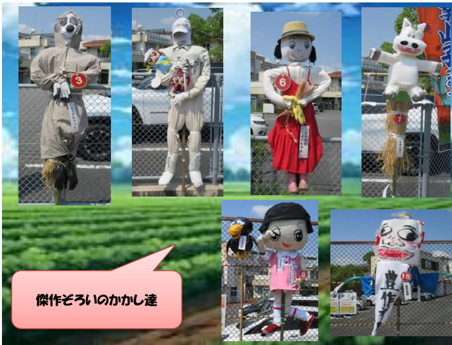
傑作ぞろいのかかし達

お問合せ ：ふれあいセンターまで 0836-58-2098 お気軽にお問合せ下さい。