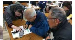
スマホ利用の為の登録指導中

エリア内の沢山の人に知ってもらって、期間中しっかり利用してもらい、いいデータを持ち帰って頂きたいと思います。そして実践でなくエリアを拡大し実際に運行してもらえると、車を持たない方々の買い物等のお出かけが楽になり、乗り合わせた人との交流も生まれてより良い地域になると期待しています。